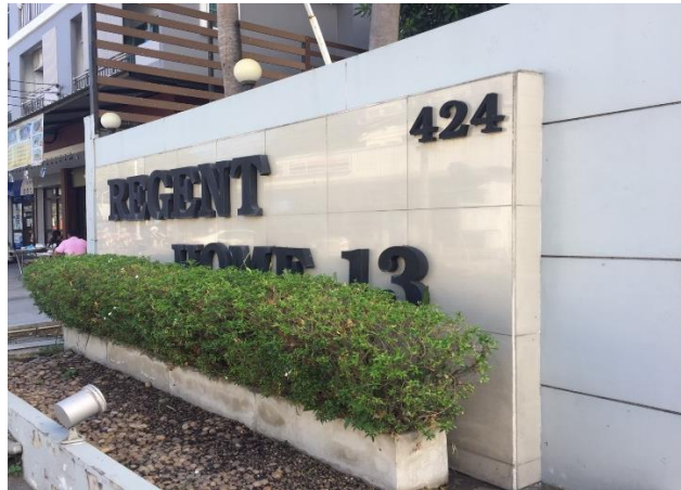
รูปที่ 1-2 สภาพปัจจุบันของโครงการ

ปัจจุบันโครงการได้เปิดดำเนินการแล้ว เป็นอาคารอยู่อาศัยรวม (อาคารชุด) ขนาดพื้นที่ 1-0-52 ไร่ ขนาดความสูง 8 ชั้น จำนวน 1 อาคาร ความสูง 22.92 เมตร (ความสูงที่ระดับพื้นชั้นดาดฟ้า) มีจำนวนห้องชุดพักอาศัย 172 ห้อง